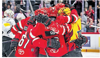
Il Losanna è ancora vivo.