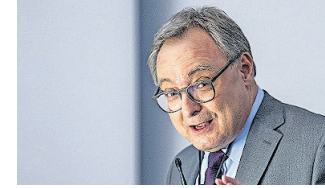
Lo storico poschiavino.