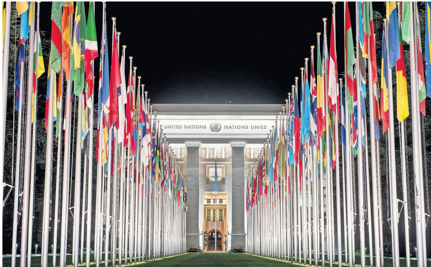
Ginevra, con la sua sede europea delle Nazioni Unite, è la capitale dell'internazionalismo elvetico.

«Nella seconda metà del XIX secolo prende forma un nuovo processo multilaterale che rappresenta una svolta rispetto all'ordine precedente, noto come "concerto europeo", un sistema di potere dominato da cinque grandi che determinano l'assetto geopolitico del continente. In quel contesto, la Svizzera - repubblicana e neutrale - è vista come un'eccezione, quasi un errore storico, e non ha voce in capitolo nelle decisioni internazionali. La sua esistenza è garantita solo perché le potenze ne hanno riconosciuto la sovranità, per tutelare i propri interessi. Un momento di svolta si verifica nel 1851, con la prima Esposizione Universale a Londra. Questi eventi, pur rappresentando l'apoteosi del nazionalismo (ogni Paese desidera mettere in mostra i propri progressi e traguardi), danno anche impulso a una nuova forma di collaborazione tra Stati. Attorno alle esposizioni nascono le prime conferenze internazionali su temi molto diversi, dalla scienza alla comunicazione. Queste conferenze vedono la partecipazione di delegati nominati dagli Stati, che fungono da rappresentanti ufficiali. Con il tempo, la frequenza e la complessità crescente di questi incontri porta alla necessità di creare uffici permanenti per gestirli: è così che nascono le prime vere e proprie organizzazioni internazionali. Questo internazionalismo liberale dell'Ottocento è particolarmente sostenuto dalla Svizzera, che ospita molte del-