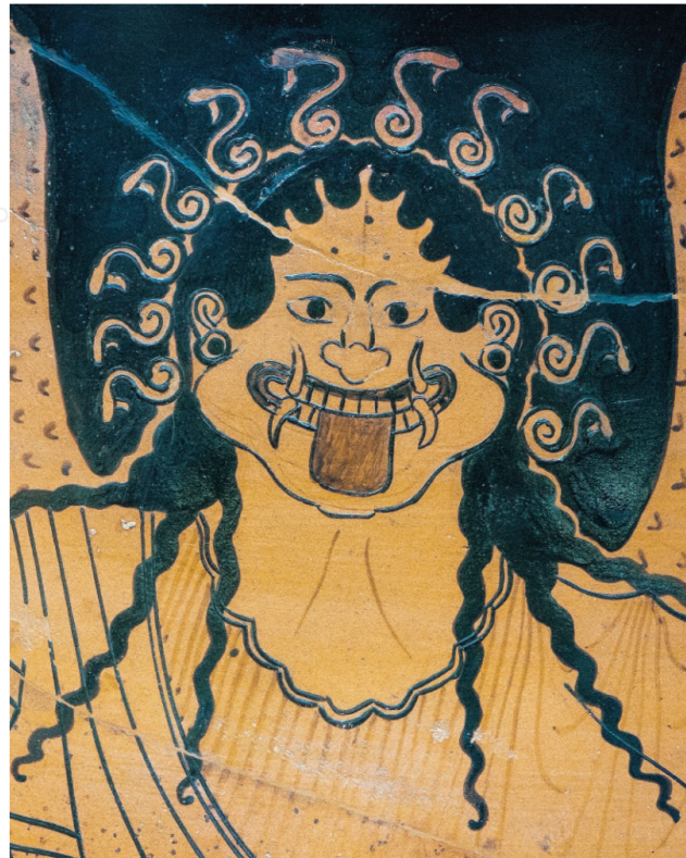
Una gorgone raffigurata in un'anfora del V secolo a.C.

Nel quale troviamo i mostri, antagonisti degli eroi nei miti che ci arrivano dall'Antichità. Mostri che in molti casi sono femminili, aspetto che secondo Giallongo rivela qualcosa di fondamentale sul rapporto tra i sessi nelle diverse epoche storiche: «I mostri femminili possono essere una metafora del rapporto tra i sessi». E i mostri maschili, come il Minotauro? Ce ne sono, ma sono figure meno importanti. «Anche il Minotauro, il primo al quale si pensa in questi casi, non ha avuto tutto questo gran successo e mentre i mostri femminili proliferavano nell'immaginario, i corrispettivi maschili erano spesso più ibridi che mostri, pensiamo ai centauri, pur essendo metà umani e metà animali, ricoprivano ruoli positivi come quello di maestro di Achille».